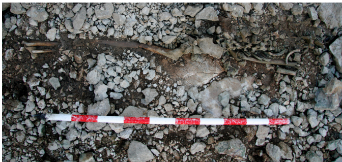
Fig. 2. Enterrament maqbara afectat per l'erosió de l'aigua.