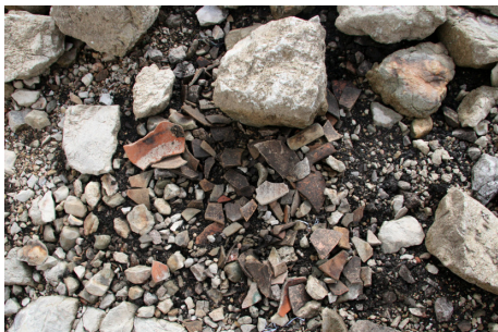
Figs. 3-4. Circumstàncies en les que es troben alguns dels materials per l'efecte de l'embassament.