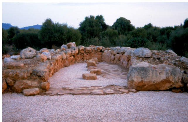
Fig. 1. Resultat final de la intervenció de 2003 al Navetiforme I.

L'any 2008 es va plantejar la necessitat de realitzar una nova intervenció de consolidació als murs del Navetiforme I (Escalas, inèdit) a causa del fet que algunes de les lloses presentaven fissures aparegudes a partir de les fluctuacions del binomi humitat-temperatura, observant, a més, eflorèscències de sals a la superfície (Fig. 2). Alhora, algunes de les restauracions realitzades l'any 2003 o anteriors es trobaven en mal estat de conservació, perdent la seva funció.