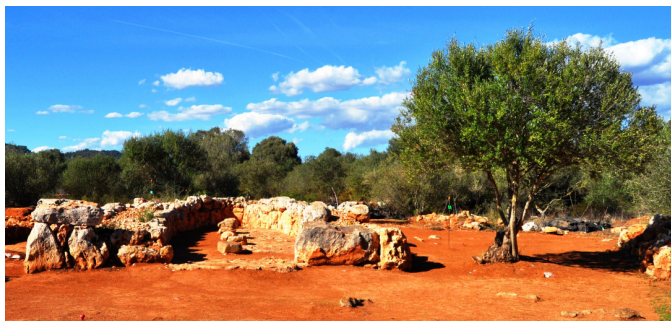
Fig. 3. Resultat final de les intervencions de 2010 al Navetiforme I.

Per resoldre aquests problemes es va plantejar realitzar una nova intervenció basada en un model d'actuació que part de l'equip directiu havia assajat al jaciment de Son Corró (Costitx) (Javaloyas et alii 2012). Aquesta actuació consistia en l'adequació la zona amb un sistema tripartit format, primerament, per una capa de grava, que evitaria el creixement de vegetació i evitaria l'estancament de l'aigua. Aquesta grava es cobrí amb un geotèxtil a sobre del qual es posava una capa de terra de color vermellós que vàrem obtenir de les terreres formades en excavar l'interior del Navetiforme I. El resultat final havia de ser una visió menys impactant de l'estructura i un posada en escena molt més semblant a la visió original però que, al mateix temps, afavorís la conservació del jaciment (evitant l'acumulació d'aigua i el creixement de vegetació a l'interior). En definitiva, del que es tractava era de conciliar els objectius que perseguïen els diferents agents participants (arqueòlegs, restauradors, públic i administració pública).