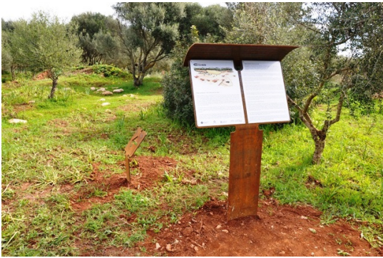
Fig. 4. Panell de benvinguda al jaciment dels Closos de Can Gaià.

En definitiva, tant per volum de turistes com per les característiques socioeconòmiques que presenta el turista mitjà, el turisme arqueològic té un enorme potencial econòmic i és capaç de generar sinergies socioeconòmiques positives en ser un turisme d'alta qualitat (Javaloyas, en premsa).