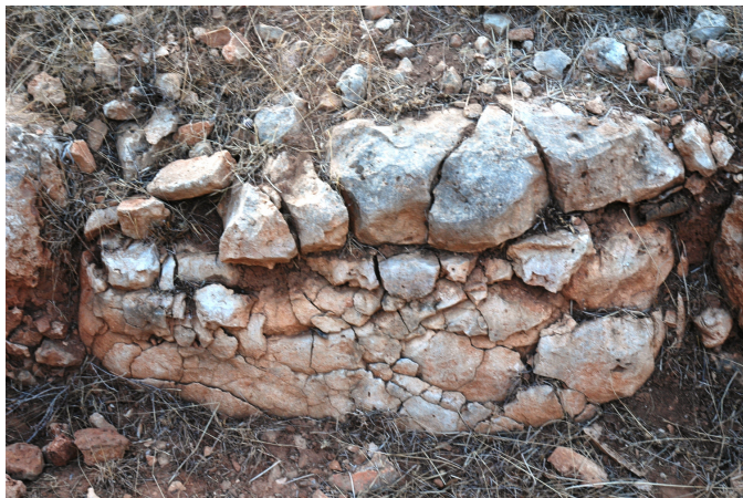
Fig. 2. Detall de la disgregació d'una llosa del parament exterior del Navetiforme I.

L'any 2010 es va realitzar una nova campanya de restauració i consolidació dels murs del Navetiforme I. La necessitat d'aquesta actuació es fonamentava en el fet que bona part dels murs d'aquesta estructura presentaven nombroses deficiències, fet que posava en perill el mateix edifici i feia necessària una intervenció de consolidació. A causa de motius antròpics i, sobretot, dels moviments produïts per les arrels dels ullastres que han nascut i crescut dins els murs de l'estructura, molts dels grans blocs del parament exterior es trobaven desplaçats del seu lloc d'origen i es varen anar descalçant, perdent totalment la seva coherència dintre del conjunt. Aquest problema havia causat greus despreniments i enderroc del reble intern, contingut inicialment per aquest parament, i havia posat en perill l'estabilitat de tot el conjunt.