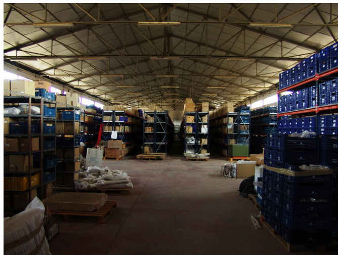
Fig. 17. Magatzem de Son Tous.