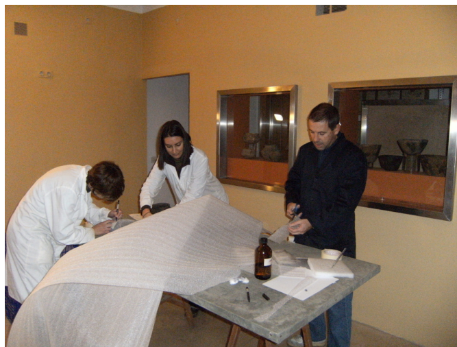
Fig. 2. Desmuntatge vitrines a les sales de prehistòria.

El desembre de 2008 comencen les obres d'emergència a Ca la Gran Cristiana. Fins aquest dia el Museu estava obert al públic, atesa l'excepcionalitat de la situació el desmuntatge es realitzava segons les necessitats de l'obra. El primer espai que s'intervingué fou la planta subterrània que allotjava les sales de prehistòria i alguns dels magatzems d'arqueologia. En aquesta fase es desmuntaren les vitrines, s'embalaren els materials i s'emmagatzemaren en les sales de reserva dels pisos superiors [Fig. 2]. Tots els canvis d'ubicació s'actualitzaven setmanalment en suport informàtic.