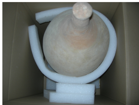
Fig. 5 Embalatge d'una àmfora.