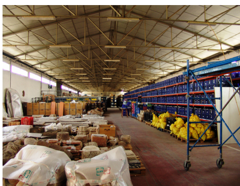
Fig. 16. Magatzem de Son Tous.

A dia d'avui la tasca principal per fer és la reorganització de l'àrea de Son Tous [Fig. 16 i 17] i l'aplicació de l'inventari topogràfic del programa DOMUS, per tal d'unificar els criteris de gestió museística.