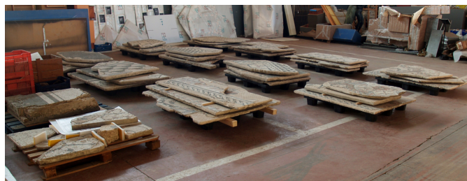
Fig. 14. Nova ubicació dels mosaics a Son Tous.