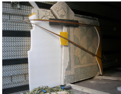
Fig. 13. Material musivari preparat per al trasllat a Son Tous.

Gran Cristiana a Son Tous [Fig. 4, 5, 6, 13, 14 i 15] i a l'edifici del Centre de Cultura de Sa Nostra, seu provisional del Museu de Mallorca mentre durin les obres. Entre març i abril es realitzaren les tasques de preparació de l'exposició permanent en el Centre de Cultura "Sa Nostra".