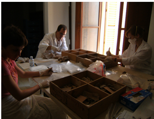
Fig. 9. Processant material de Pollentia .

A començament de 2010 es traslladaren els materials de Son Toells a Son Tous. Durant la resta de l'any les tasques es concentraren en el processament dels materials en el nou magatzem així com en els ingressos de nou material. Paral·lelament a l'ingrés de nous materials entraren fons antics assignats al museu: material arqueològic i paleontològic de Pollentia [Fig.7] i material arqueològic de les excavacions realitzades per William Waldren [Fig. 8]. Aquests materials també es processaren com si fossin nous ingressos. D'entre els dos grans lots es va prioritzar el material de Pollentia ja que ingressà abans i les condicions d'algunes de les unitats d'instal·lació obligaven a fer una tasca de conservació urgent [Fig. 9, 10, 11 i 12].