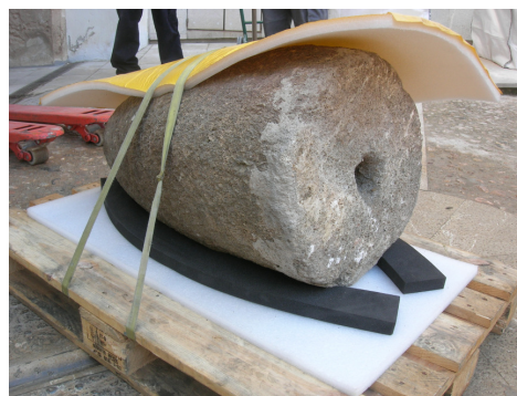
Fig. 6 Molí de rotació del Sec.