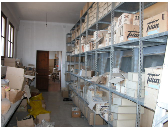
Fig. 3. Àrees de reserva a la Casa de Cultura.

al Museu, Son Toells, per portar-hi el fons arqueològic que fins aleshores estava a Ca la Gran Cristiana. El moviment es realitzà entre els mesos de febrer i juliol. De manera paral·lela al moviment de Ca la Gran Cristiana a Son Toells, s'inicià l'embalatge i preparació dels materials arqueològics que estaven a la Casa de Cultura. Pel novembre del mateix any s'assigna un magatzem definitiu al Museu de Mallorca: la nau de Son Tous. I un mes després, s'inicia el trasllat dels materials arqueològics de la Casa de Cultura a Son Tous.