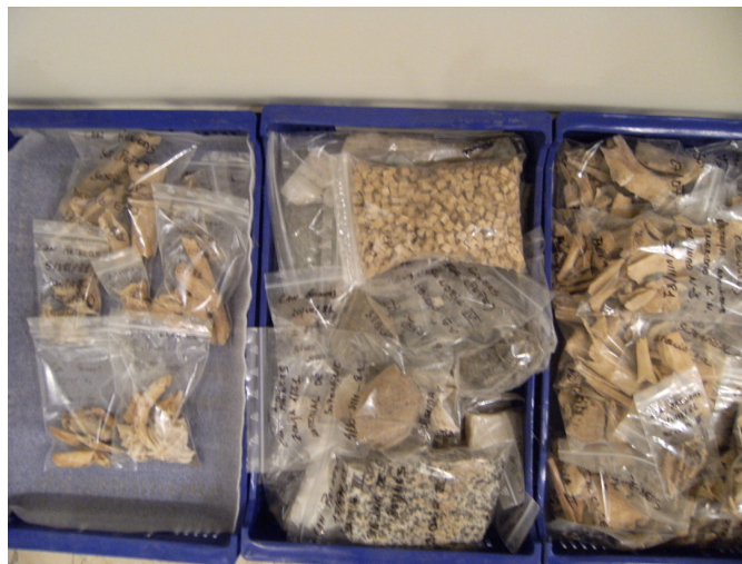
Fig. 11. Material arqueològic després de la intervenció.