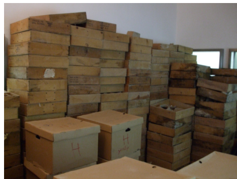
Fig. 7 Ingrés de material de les excavacions de Pollentia .