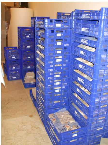
Fig. 12. Material de Pollentia preparat per al trasllat a Son Tous.

Les tasques de conservació del fons continuaren durant tot el 2011. Al llarg d'aquests anys els ingressos de nous materials arqueològics han estat constants, ja que els materials procedents d'un alt nombre d'intervencions arqueològiques estan assignats al Museu de Mallorca.