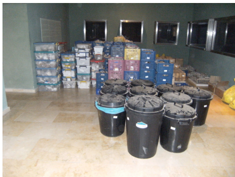
Fig. 8. Ingress de material de les excavacions de William Waldren.

A començament de 2010 es traslladaren els materials de Son Toells a Son Tous. Durant la resta de l'any les tasques es concentraren en el processament dels materials en el nou magatzem així com en els ingressos de nou material. Paral·lelament a l'ingrés de nous materials entraren fons antics assignats al museu: material arqueològic i paleontològic de Pollentia [Fig.7] i material arqueològic de les excavacions realitzades per William Waldren [Fig. 8]. Aquests materials també es processaren com si fossin nous ingressos. D'entre els dos grans lots es va prioritzar el material de Pollentia ja que ingressà abans i les condicions d'algunes de les unitats d'instal·lació obligaven a fer una tasca de conservació urgent [Fig. 9, 10, 11 i 12].