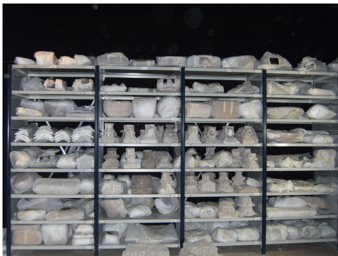
Fig. 1. Un dels magatzems controlats de Ca la Gran Cristiana.

Paral·lelament es varen anar comprovant les sigles de les peces amb les fitxes d'inventari. A mesura que s'anava processant cada caixa, es passava la informació a suport informàtic. Per aquelles peces arqueològiques que reunien determinades característiques físiques o un valor superior es crearen tres magatzems, un per a metalls i material orgànic i altres dos per a ceràmica i pedra [Fig. 1].