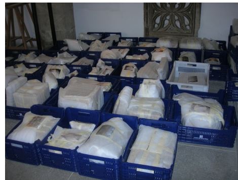
Fig. 15. Material lític preparat per al moviment.