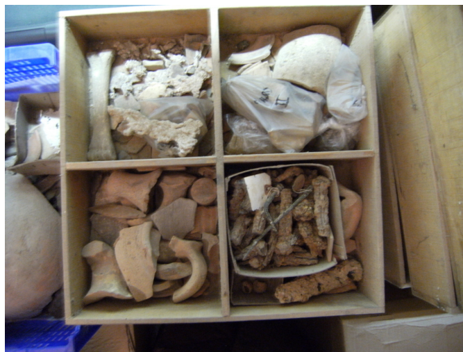
Fig. 10. Material arqueològic abans de la intervenció.