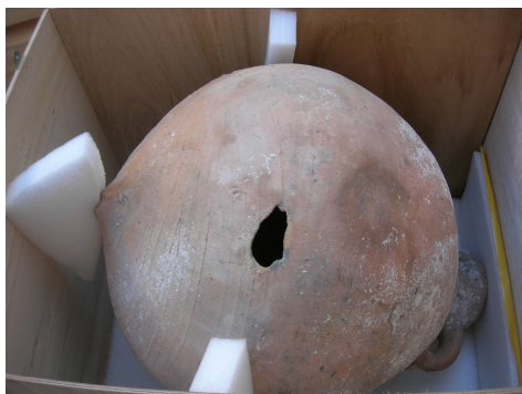
Fig. 4. Embalatge d'una àmfora.