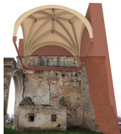
Monestir de la Mejorada Valladolid