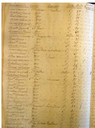
Padró d'habitants de Sant Francesc de Formentera de 1834 l'Arxiu Històric d'Eivissa