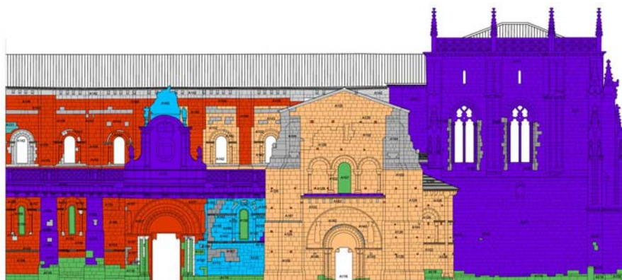
Basilica de San Isidoro - Lleó

15 hores: 12 de teòriques i 3 de pràctiques = 1,5 crèdits