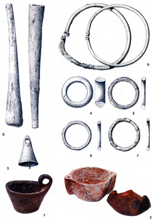
Figura 2. Tirant: núm. 1 Tassa amb ansa, núm. 2 Peveter amb tapadora, núm. 3 campaneta, núm. 4-7 braceroles, núm. 8 bastons de comandament, núm.9 torques (dibuixos 3-9 Museu Arqueològic Nacional, Madrid).