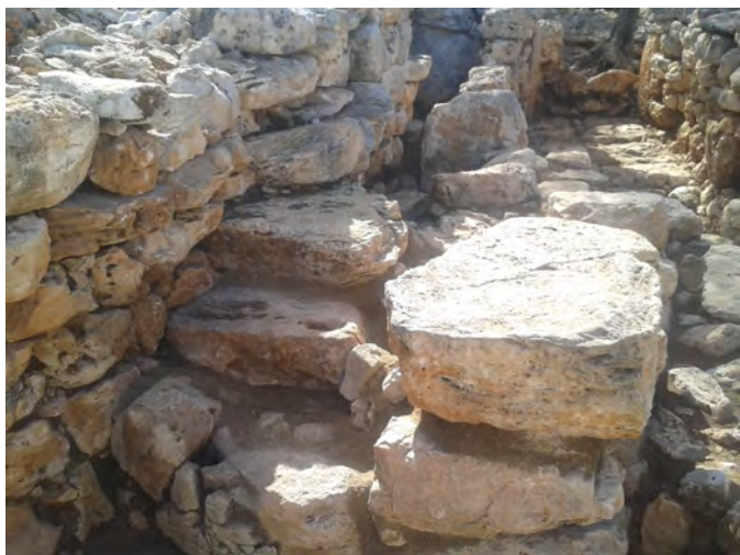
Figura 4. Imatge de l'escala amortitzada que formaria part de la banqueta o plataforma del pati.

La restauració d'aquest element va permetre identificar que havia estat construït adossat i possiblement amortitzant, una escala que es trobava parcialment encastada al mur oriental de l'edifici (Fig. 4). A més, es va poder corroborar que el rebllit d'aquesta plataforma de funció desconeguda incloïa utensilis lítics reaprofitats. Així es va identificar un gran morter cilíndric que probablement es va trencar durant el procés d'elaboració, que es va deixar in situ , i un fragment de pica que es va recuperar i substituir per un altre bloc de mida semblant.