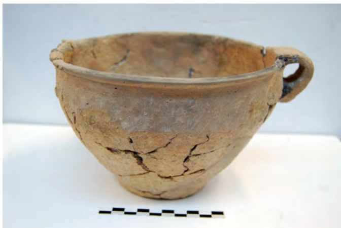
Figura 3. Vas localitzat a l'exterior de la façana de l'habitació I.

ment, com l'exterior 2 del talaiot. Només a la zona en contacte amb el corredor hi ha tres lloses planes molt desgastades (una d'aquestes, un brancal amortitzat d'una altra habitació) que estan assentades damunt l'empedrat UE 63 i s'adossa a la UE 62, el mur de separació entre el corredor i l'habitació M. Per tant, seria un fragment de la banqueta posterior a la segona fase del corredor i a l'habitació M.