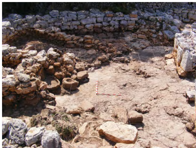
Figura 2. Vista del pati des de l'est, on s'aprecien el morter, la pica i la pedra plana falcada, situades davant la façana de l'habitació I.

L'excavació del pati també va proporcionar altres instruments lítics de gran interès per a la interpretació de l'ús d'aquest espai. Així, a les immediacions de la pica i el morter es va localitzar un gran bloc falcat i de superfície plana que molt probablement hauria estat utilitzat com a superfície de treball. A més, es van trobar diversos molins, tant de vaivé com de rotació, alguns de complets i altres en estat fragmentari.