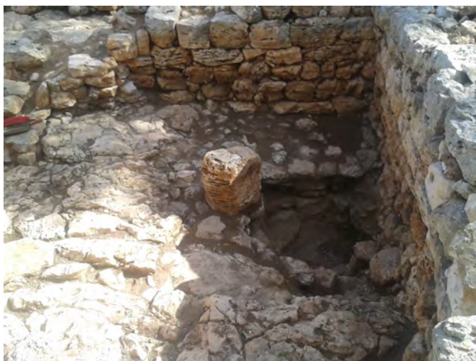
Figura 5. Vista de l'habitació J, amb el sitjot, una vegada restaurada.

En aquesta habitació també es van enretirar els diferents nivells d'enderroc UE 31 i UE 32, on aparegué material ceràmic d'importació que, juntament amb el del pati, ha permès datar aquest moment. Per sota de la UE 32, aparegué un nivell de terra marró molt obscura que presentava concentracions de ceràmica i alguns carbons. Com aquest sector no estava en contacte amb la UE 33 del pati, se li va donar una unitat nova: UE 35. Una vegada enretirada la UE 35, es van diferenciar unitats estratigràfiques (UE 36, 37, 38 i 49) dins l'habitació, que es van documentar a una mateixa cota. El sediment es caracteritza per ser molt depurat i tenir un color groc, a les zones properes a les parets interiors apareix molt net i cap al centre de l'habitació, amb pedres petites o argila cuita. Enmig de l'habitació es conservava un tambor de columna amb un nivell de preparació que quan es va excavar estava cobrint la boca d'un sitjot ( Fig. 5 ).