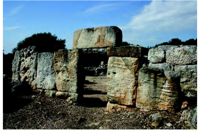
Figura 1. Porta d'accés al recinte Cartailhac (Projecte Modular©).

després observar-hi l'aplicació pràctica a les unitats domèstiques posttalaiòtiques (talaiòtiques finals o baleàriques) de Mallorca i Menorca.