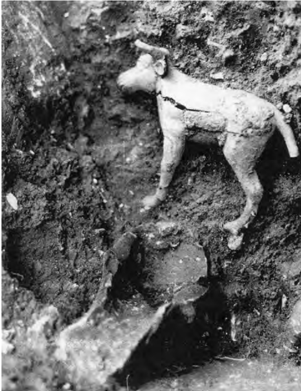
Figura 4. El toro en bronce en Torralba d'en Salord.

Junto a los hallazgos metálicos, se descubrieron otros objetos ceremoniales de cerámica. En la piedra de apoyo de la piedra taula de Torreta de Tramuntana, por ejemplo, estaba depositada una pequeña terracota en forma de cabeza femenina. Este fragmento —probablemente de origen púnico— ha sido relacionado, al igual que en Torralba d'en Salord, con una deidad femenina (Murray et al. , 1934, 11). Finalmente, en un lugar no precisado del santuario de Trepucó se documentó un brazo con el puño cerrado de terracota (Murray et al. , 132 40). Además, en un pequeño nicho de la pared sudoeste se encontró un conjunto de cerámica fragmentada. No obstante, no se sabe con certeza si este descubrimiento puede interpretarse realmente como una deposición (Murray et al. , 1932, 15).