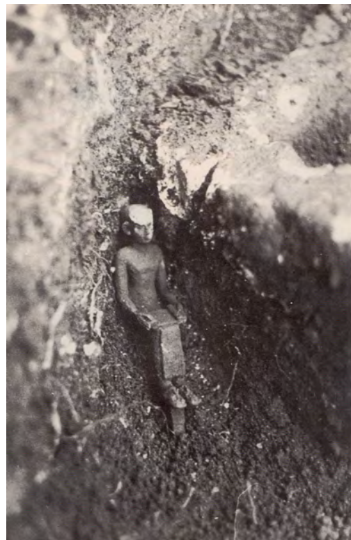
Figura 3. El contexto arqueológico de la estatua de Imhotep en Torre d'en Galmés.

Fig. 4 ). También en la misma zona, se descubrió un altar con sus cuatro patas imitando las de un caballo, y también una terracota en la con forma de cabeza femenina, probablemente representando a la diosa púnica Tanit (Fernández-Miranda Fernández 2009, 90-93). Este hallazgo ha sido datado en el siglo III aC (Van Strydonck 2016, 105). Sin embargo, este no fue el único hallazgo de metal recuperado en el santuario. Se cree que dos anillos de bronce junto con huesos fueron depositados en un asiento de piedra ubicado en la pared de la esquina sureste del monumento ( Fig. 2c ) (Fernández-Miranda Fernández, 2009, 50).