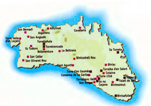
Figura 1. Distribución de los santuarios taulas en Menorca. Los monumentos estudiados están en color negro.

Este estudio se basa en el análisis de la literatura científica disponible para los recintos menorquines. Se seleccionaron nueve monumentos para los que se disponían datos sobre posibles patrones de deposición y distribución. Estos yacimientos cubrieron un largo período de investigación. Los más antiguos fueron excavados en los años treinta y el más reciente a finales del siglo pasado (Tabla 1).