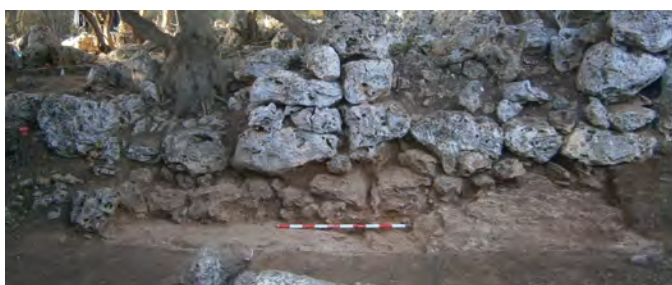
Figura 6. Cala 1, on s'aprecia el parament extern del mur nord d'R1 (amb una falsa aparença d'adossament que el parament intern desmenteix) amb l'estrat d'anivellament (UE 8) del qual prové la mostra datada radiocarbònicament.

La mostra RICH-23601 ha donat uns resultats a una sigma de 1000 BC (68,2 %) 895 BC i a dues sigmes de 1020 BC (95,4 %) 830 BC, la qual cosa estableix preliminarment una forqueta entre el prototalaiòtic i els inicis de l'època talaiòtica per a la construcció de l'edifici adossat a T1. En tot cas, aquesta primera datació haurà de confirmar-se amb la datació d'altres unitats estratigràfiques (estructurals o sedimentàries) del complex arquitectònic.