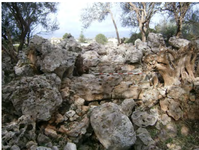
Figura 3. Façana de T1, orientada a sud-est. Lloses del corredor d'entrada conservades in situ .

Des de l'angle est de T1 es projecta un mur seguint la línia de la façana nord-est del talaiot. Presenta una amplada d'entre 1,30 i 1,50 m i una longitud de 8,70 m. S'ha determinat aquest mur com a pertanyent a una estructura annexa a la façana principal del talaiot, la qual ha rebut la denominació d'R1. A 6,2 m de distància hi ha un segment de mur paral·lel a l'anterior i que conserva 5,8 m de longitud. De manera preliminar aquesta estructura mural s'ha considerat del mateix recinte 1.