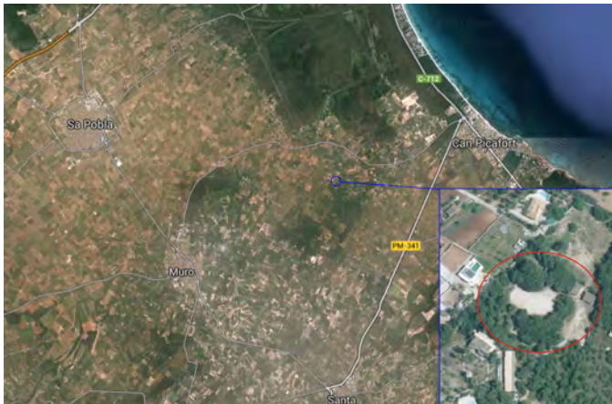
Figura 1. Situació geogràfica del jaciment de Son Serra. A baix i a la dreta s'observa en detall la fotografia aèria del jaciment amb anterioritat a la seva intervenció.

El jaciment es troba afectat per l'actuació de maquinària que en un moment indeterminat el va dividir en dues parts. L'esplanada central resultant és ara utilitzada com a pista d'equitació. Les rases efectuades amb seguiment arqueològic han permès descartar la conservació de jaciment pràcticament a tots els punts de l'esplanada.