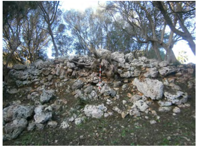
Figura 2. Talaiot 1, pel seu flanc nord-est.

cés es trobi notablement descentrat. De fet, un dels paraments del corredor és el mateix mur d'un dels laterals de la cambra. Aquesta disposició es troba també al talaiot de planta quadrada A de Capocorb Vell, a Lluçmajor (Bosch Gimpera i Colominas 1937), i, en certa mesura, en el talaiot sud de Cascanar a Sencelles (Aramburu-Zabala 2011, fig. I.8 i II.1), si bé en aquest darrer cas la disposició és diferent, ja que el corredor arrenca de la cantonada est de la cambra i es desenvolupa en diagonal cap al centre de la façana principal.