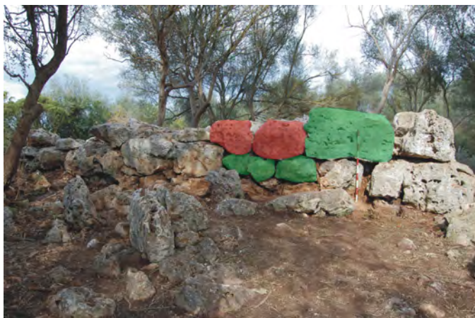
Figura 7. Restauració del flanc sud-oest de T1. Reposició de pedres originals (en verd) i aportades (en vermell).

tallers infantils. També s'ha obert la intervenció arqueològica a la participació de voluntariat local, al qual s'ha afegit la presència de voluntariat del Servei Civil Internacional (SCI). A partir d'activitats conjuntes organitzades en col·laboració amb entitats culturals del municipi s'ha volgut propiciar la relació entre persones i entitats de l'àmbit local i el voluntariat internacional, amb la intenció de donar a conèixer el patrimoni arqueològic a tots els participants i fer ressò del projecte de Son Serra entre els habitants del municipi, alhora que es mostrava a persones d'altres països el patrimoni i la cultura local.